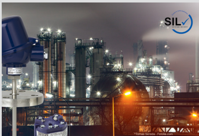
En la industria conviven numerosas variantes de termómetros