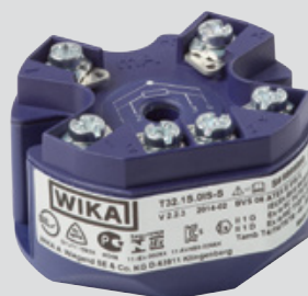
Transmisor de Temperatura WIKA T32. xS con protocolo Hart

La temperatura es la magnitud física más medida en la industria de procesos, y desde sus inicios hace 130 años han aumentado sin parar las variantes de su instrumentación a cifras innumerables. Los criterios para todos los dispositivos siguen siendo la exactitud y la fiabilidad a largo plazo.