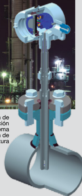
Construcción de una instalación típica de un sistema de medición de temperatura

Para evitar catástrofes como la de Seveso en 1976, existen normativas como la IEC/EN 61508, que definen la fiabilidad y la seguridad de sistemas electrónicos, denominado SIL ( Safety Integrity Level ). En los instrumentos eléctricos estas normativas se refieren al transmisor y no al sensor, o sea, el componente propio que capta la temperatura. Dado que el transmisor y el sensor no funcionan por sí solos, hay que evaluar el conjunto y comprobar su idoneidad bajo los criterios SIL.