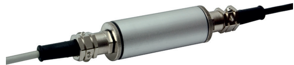
Аналоговый кабельный усилитель, модель EZE09